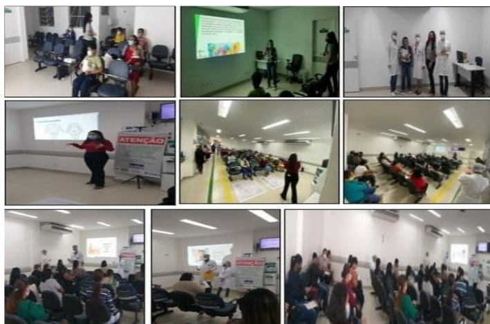
Figura 8 - Eventos Julho 2021