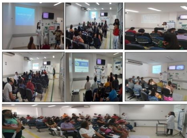
Figura 12 - Eventos Novembro 2021