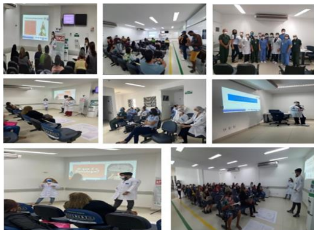
Figura 9 - Eventos Agosto 2021