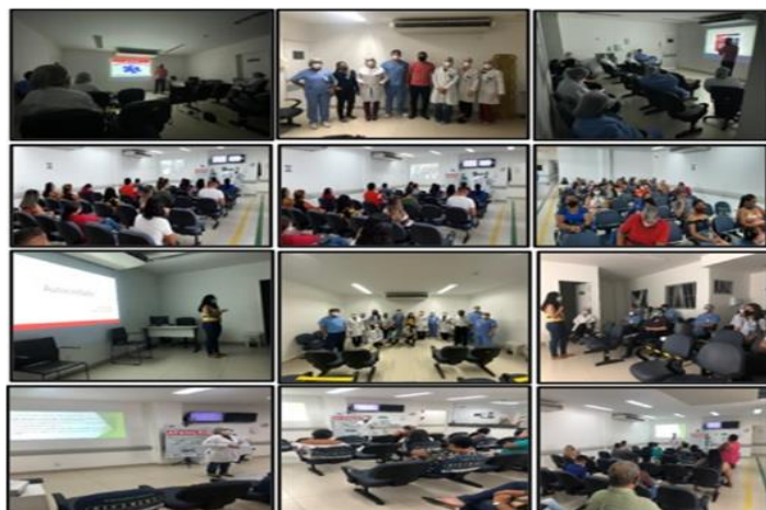
Figura 05 - Eventos Abril 2021