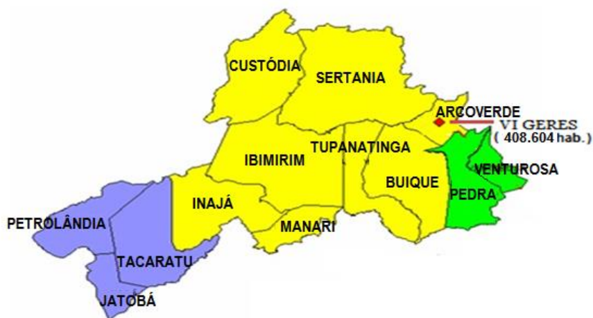
Figura 01 – Mapa dos municípios atendidos pela UPAE de Arcoverde.