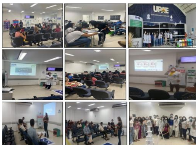
Figura 13 - Eventos Dezembro 2021