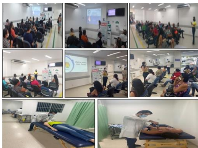
Figura 10 - Eventos Setembro 2021