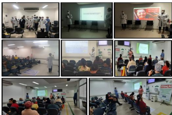
Figura 04 - Eventos Março 2021