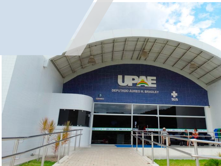
UPAE Arcoverde Unidade Pernambucana de Atenção Especializada