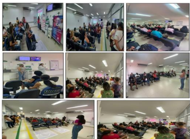
Figura 11 - Eventos Outubro 2021