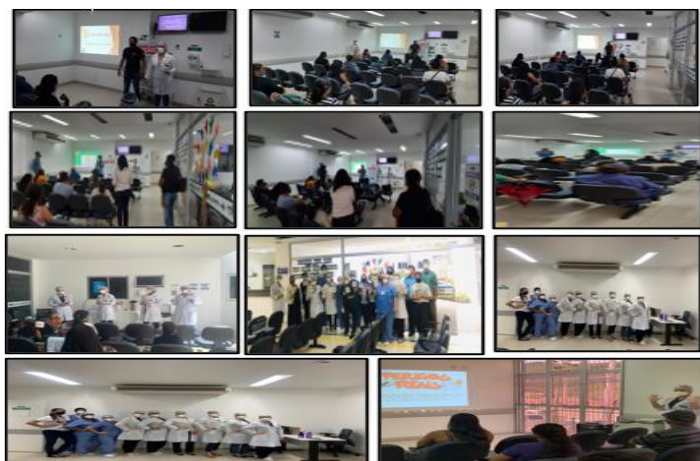
Figura 06 - Eventos Maio 2021