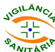
Vigilância Sanitária do Recife